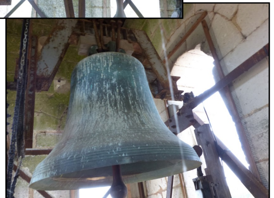
En haut, la plus petite cloche (490 kg), donne le La et, en bas, la plus grosse (1 000 kg) donne le Mi.